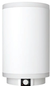
PSH 30 - 200 Trend

Uwaga! Urządzenia ciśnieniowe muszą być wyposażone w zawór bezpieczeństwa o ciśnieniu otwarcia 6 bar, posiadający znak CE!